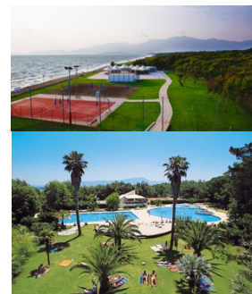
Unsere Unterkunft in Baia Domizia

Für die Anmeldung ist es im 1. Schritt wichtig, dass Ihr Euch unter folgendem Anmelde-link anmeldet: