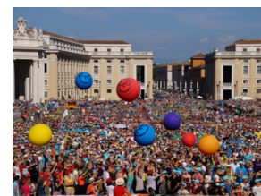
Papstaudienz mit tausenden Ministrantinnen & Ministranten